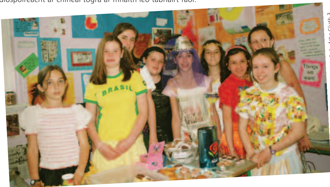
Lá Chearta an Duine ag Naomh Uinseann GNS, Baile Atha Cliath 3

Úsáid na teistiméireachtaí ó scoileanna ar Bhileog shaothair 10.1 agus 10.2 mar thúsphointe don díospóireacht ar chineál togra ar mhaith leo tabhairt faoi.