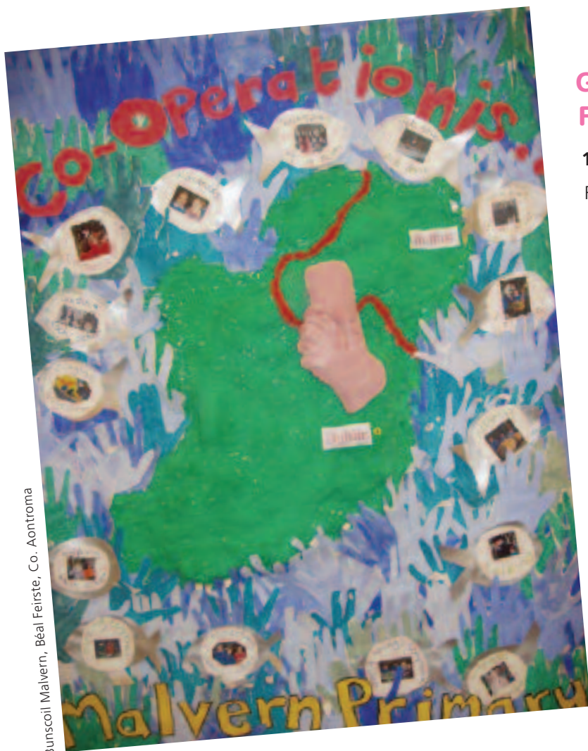
Bunscoil Malvern, Béal Feirste, Co. Aontroma